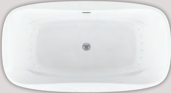
LIBRA STELLA 7038 (AUTOPORTANT)